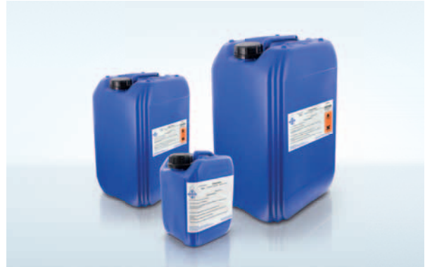
Unsere Flussmittel gibt es in den gängigen Gebindegrößen von 2,5 Liter, 10 Liter und 25 Liter.

Das Verzinnen von Kupferlackdrähten ist mit dem Flussmittel 500-17/1 sehr gut möglich. Das speziell für den Tauchlötprozess entwickelte Flussmittel garantiert durch seinen sehr hohen Feststoffanteil, dass auch bei den hohen Temperaturen des Tauchlötbad es noch genügend aktives Flussmittel an dem zu verlötenden Bauteil vorhanden ist. Auch wenn Teile des Flussmittels durch die hohen Temperaturen im Lötbad zerstört werden, wird ein gutes Lötresultat erzielt.