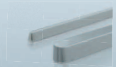
STANGEN & BARREN